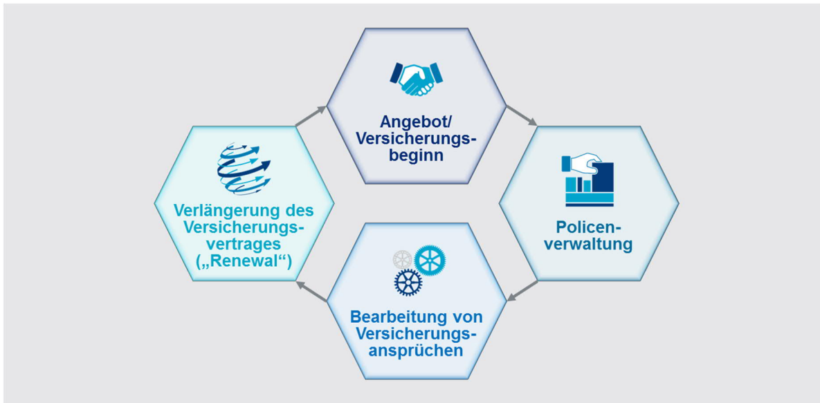
GRAFIK 2: FLUSS PERSONENBEZOGENER DATEN DURCH DEN VERSICHERUNGSLEBENSZYKLUS